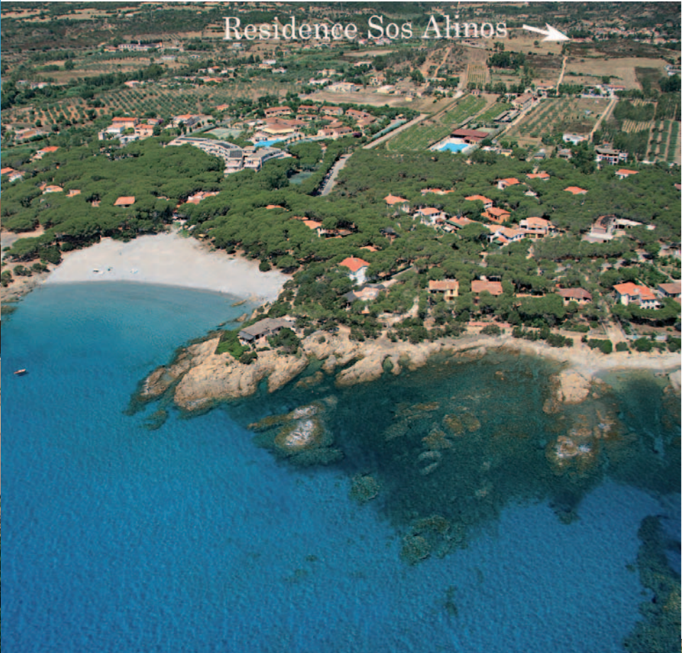
Residence Sos Alinos